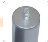
S - pouzdro se šroubem