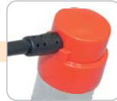
K - kabel