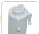
Q - pouzdro s přičítkou