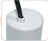
H - kabel