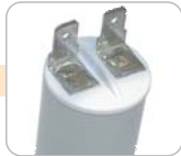
J - konektor velký