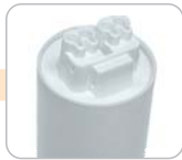
R - BJB koncovka