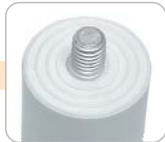
S - pouzdro se šroubem