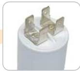
D - konektor dvojitý