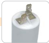
X - konektor velký proti sobě