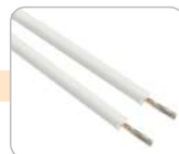
L - lanko izolované