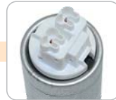
P - násuvný adaptor BJB