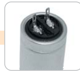
E - pájecí očka