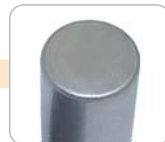
B - pouzdro bez šroubů