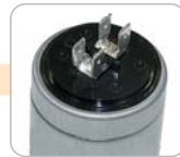
D - konektor dvojitý