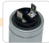
J - konektor jednoduchý