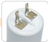
M - konektor malý