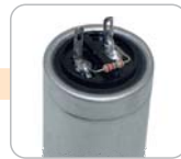
A - pájecí očka + odpor