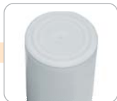
B - pouzdro bez šroubu