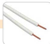
I - drát izolovaný