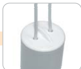
I / L - drát / lanko izolované